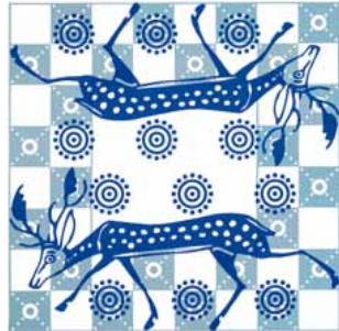
Large papers : 2007/2010, acrylique sérigraphié sur Papier Rives BFK 1,20 x 1,07 m