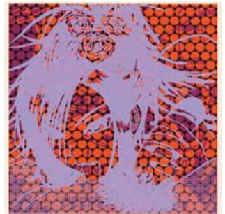
Mangas, yantras y otras cosas : 2009/2010, acrylique sérigraphié sur Papier Rives BFK, 0,25 x 0,25 m

ont disparu ou vont disparaître » souligne l'artiste. Cernés par les signes, les corps, féminins la plupart du temps, participent de cette énergie émanant des œuvres. Jean-Pierre Sergent juxtapose époques et civilisations.